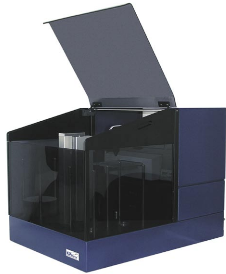
LSK Delta 3