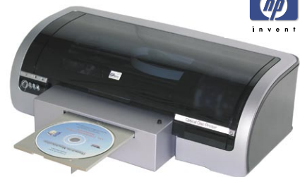
LSK ODP 200