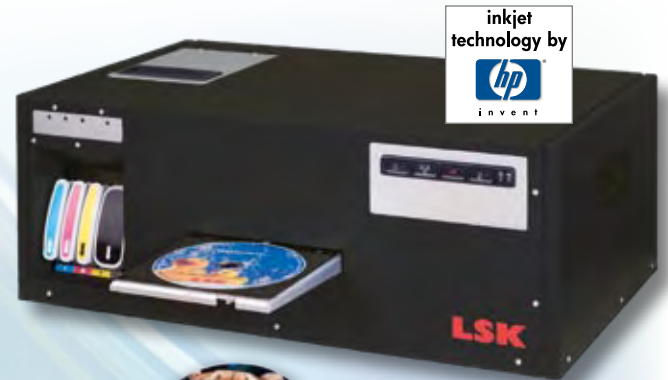
ODP 500 Thermal InkJet Disc Printer

Der ODP 500 überzeugt durch seine hohe Druckkapazität. In flüsterleisem Betrieb beschreibt der ODP 500 bis zu 200 Discs pro Stunde vollflächig in Fotoqualität. Die genaue Kapazität ist abhängig vom jeweiligen Druckjob und Druckmodus. Drei unterschiedliche Druckmodi mit je drei verschiedenen Auflösungen sind einstellbar. Die Kapazität pro Tintensatz liegt bei einer ausgewogenen Farbmischung bei circa 1350 Discs.