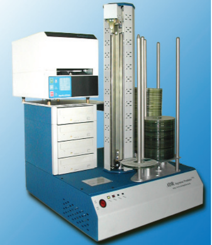
PowerPro III THERMOTRANSFER

Auch wenn die Druckauflösung des PowerPro III mit seinen 300 x 600 dpi keinen wirklich überzeugenden kann hat das Thermotransfer Druckverfahren aufgrund seiner niedrigen Druckkosten und der sofortigen Wasserfestigkeit auch heute noch seine Daseinsberechtigung. Mit nur knapp 3,5 Cent für einen Schwarzweißdruck ist der Drucker sicherlich eine gute Lösung wenn es lediglich darum geht die CD/DVDs mit einem Text zu bedrucken.