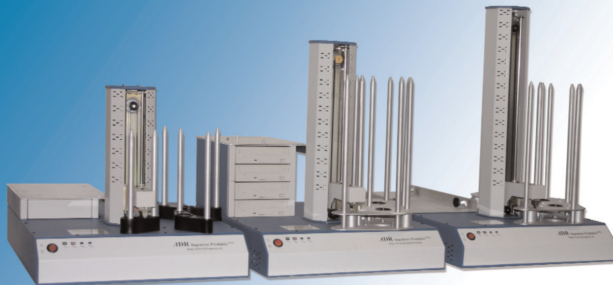
HURRICANE 125-375 DISCS